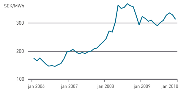
Spotpriser (rörliga priser) i Sverige.