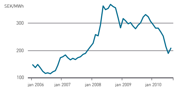
Spotpriser (rörliga priser) i Sverige.