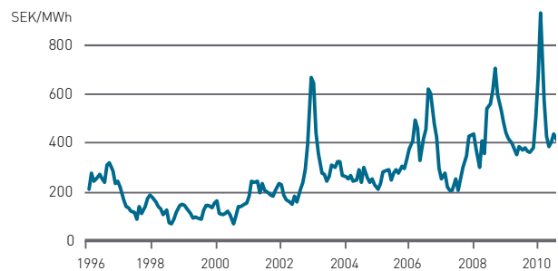
Spotpriser (rörliga priser) i Sverige 1996-2010. Källa: Nord Pool och European Energy Exchange (EEX).